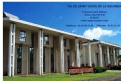
TOU DE SAINT-DENIS DE LA REUNION 1 Avenue André Malraux Château Fleuret BP 528 97400 SAINT-DENIS 97400 SAINT-DENIS Cedex Téléphone : 02.62.45.33.50 - Télécopie : 02.62.45.33.50