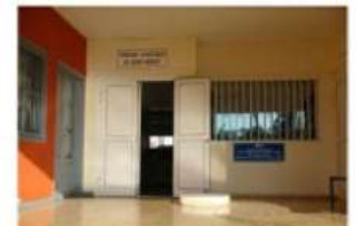
TRIBUNAL D'INSTANCE DE SAINT-BENOIT N° 2 et 4 Rue Philbert 97476 SAINT-BENOIT STANDARD 02 62 50 37 29 FAX 02 62 50 09 44